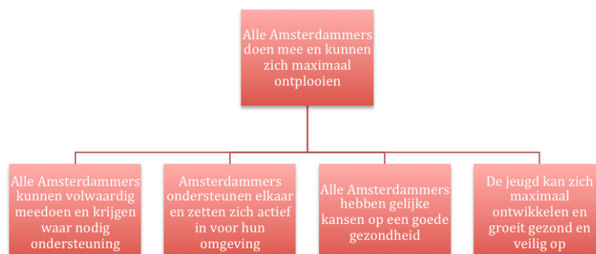
Figuur 1 – Missies voor het sociaal domein

De werkwijze waarmee de gemeente haar doelen wil bereiken, komt aan bod in hoofdstuk 4. De volgende uitgangspunten uit de Visie Sociaal Domein en andere eerder